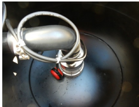
eingebaute Pumpe Minox 37 V-A